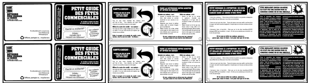
Rectos des trois originaux

2- Les photocopier. Chaque paquet de trois originaux donne deux petits guides.